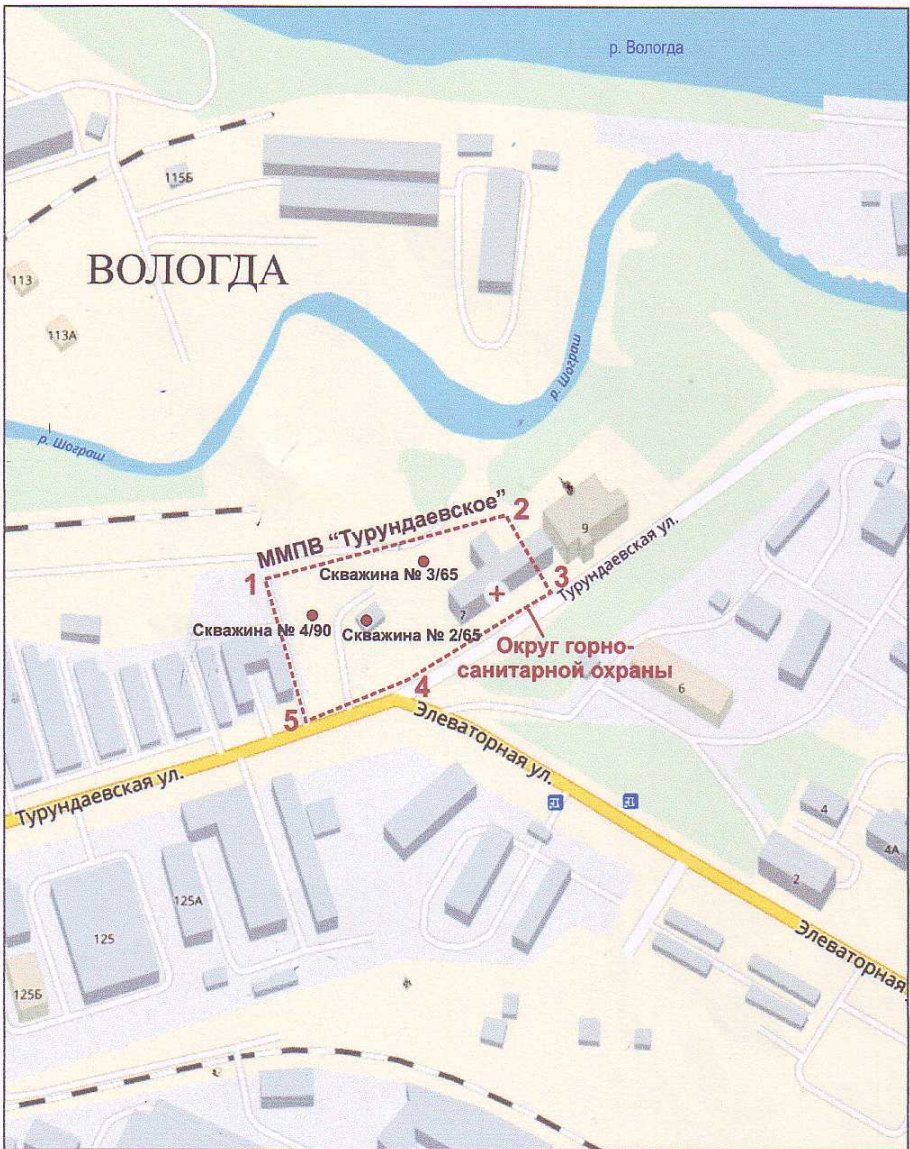
СХЕМА РАСПОЛОЖЕНИЯ УЧАСТКА НЕДР